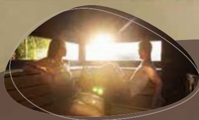
8 heerlijke sauna's